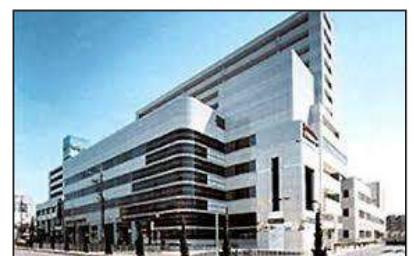
なごや福祉用具プラザ