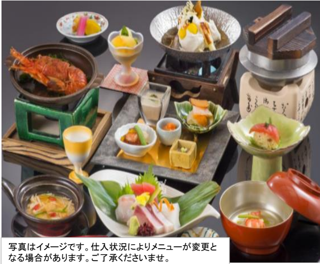
写真はイメージです。仕入状況によりメニューが変更となる場合があります。ご了承くださいませ。