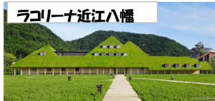
ラコリーナ近江八幡