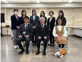
2025年度登録要約筆記者 (伝達式にて。欠席者数名あり)