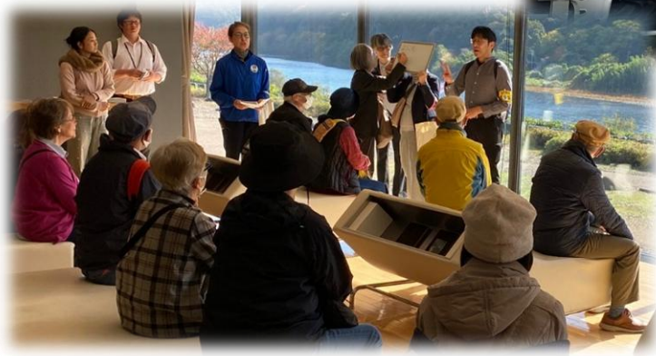
2025年11月「岐阜方面バスツアー」