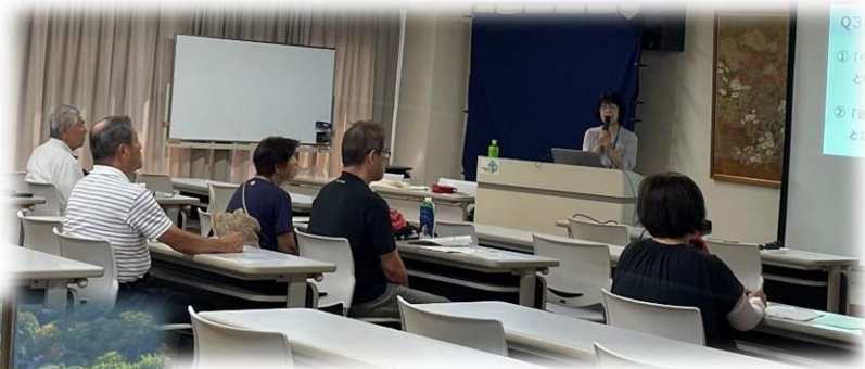
2025年8月「消費生活講座」