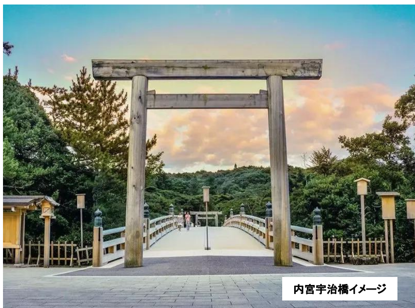
内宮宇治橋イメージ