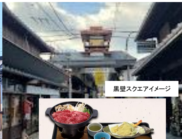
黒壁スクエアイメージ