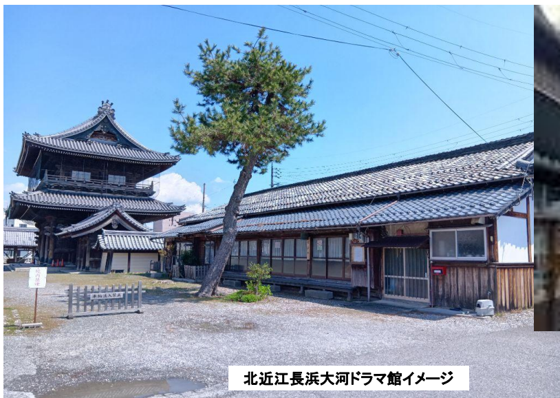
北近江長浜大河ドラマ館イメージ