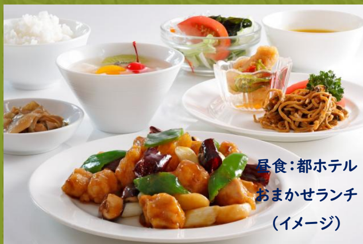
昼食：都ホテル おまかせランチ （イメージ）