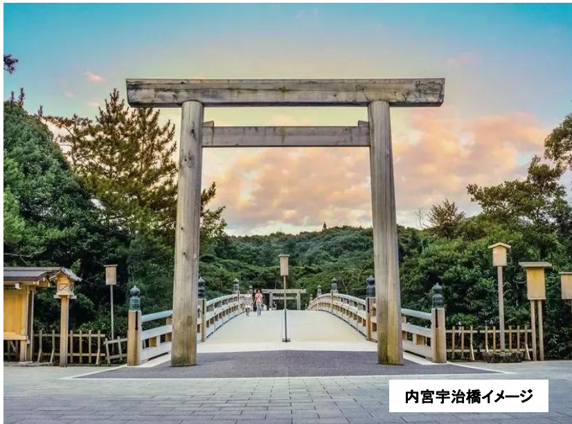
内宮宇治橋イメージ