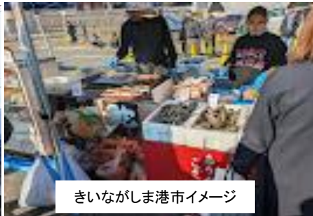
きいながしま港市イメージ