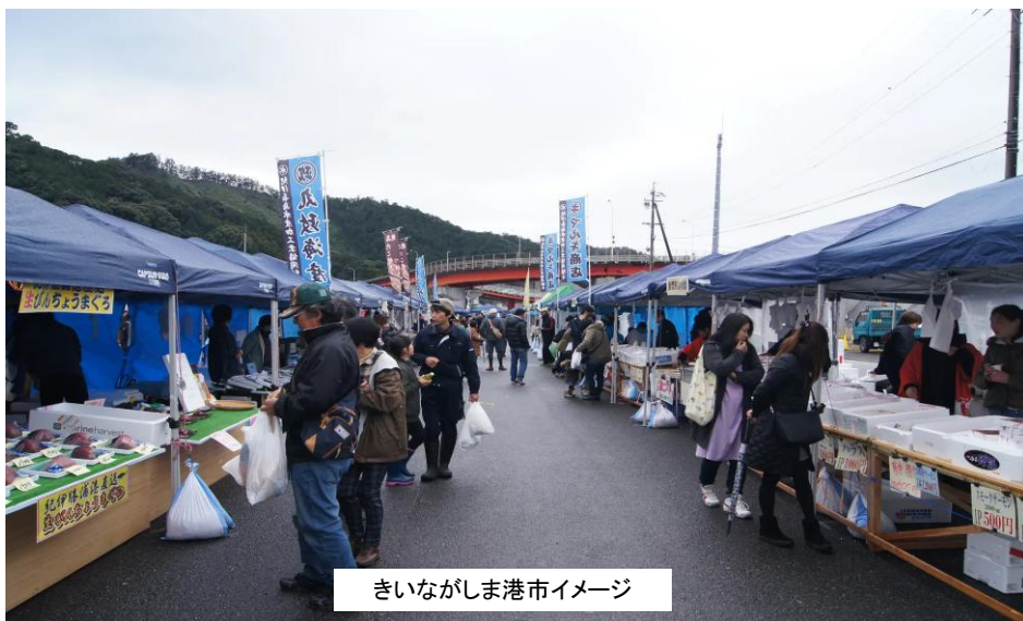
きいながしま港市イメージ