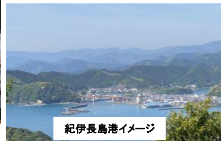
紀伊長島港イメージ