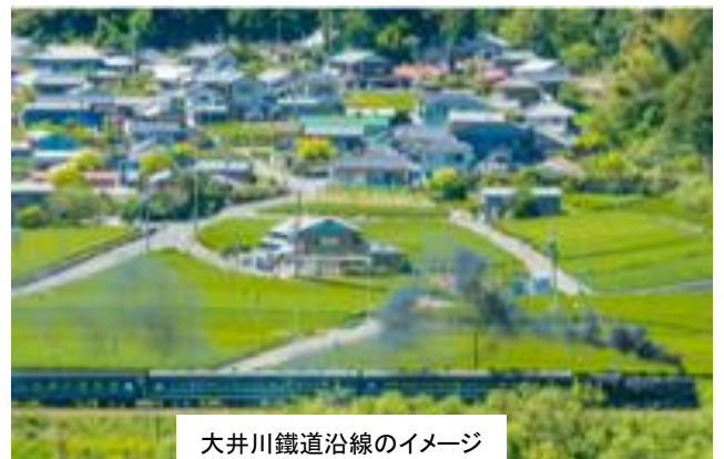
大井川鐵道沿線のイメージ