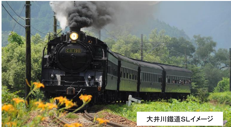
大井川鐵道SLイメージ