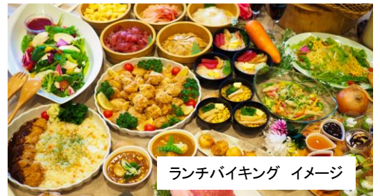
ランチバイキング イメージ