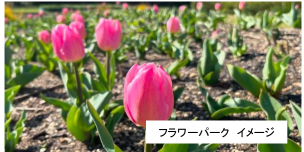
フラワーパーク イメージ