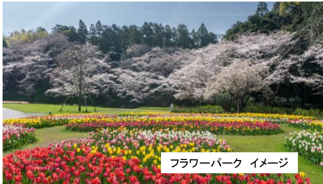
フラワーパーク イメージ