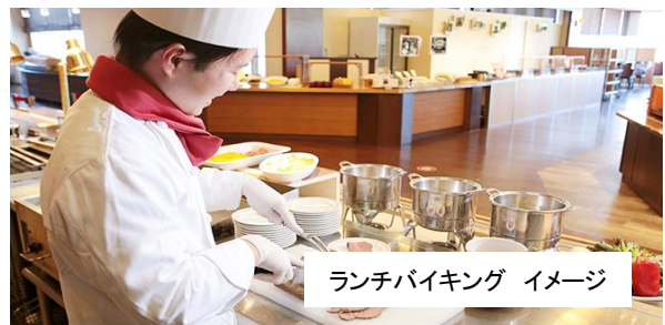
ランチバイキング イメージ