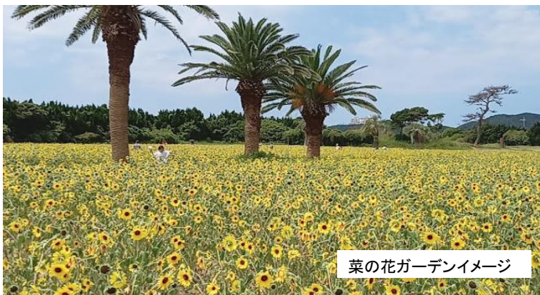
菜の花ガーデンイメージ