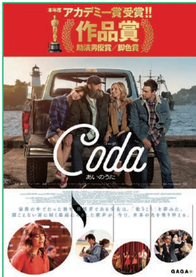
© 2020 VENDOME PICTURES LLC, PATHE FILMS

アカデミー賞受賞作「コーダ あいのうた」を上映。家族の中で唯一の健聴者ルビーの歌声が世界を彩る。