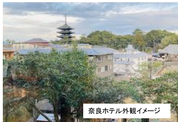
奈良ホテル外観イメージ