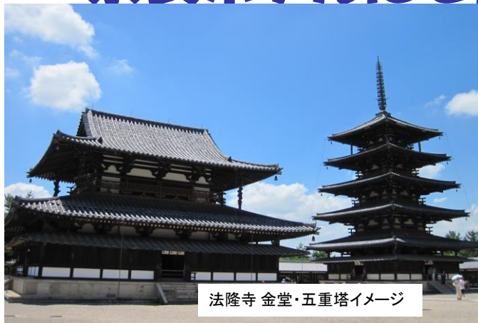
法隆寺 金堂・五重塔イメージ