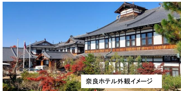
奈良ホテル外観イメージ