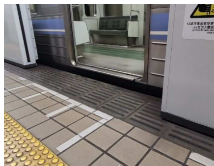
段差・隙間の縮小なし