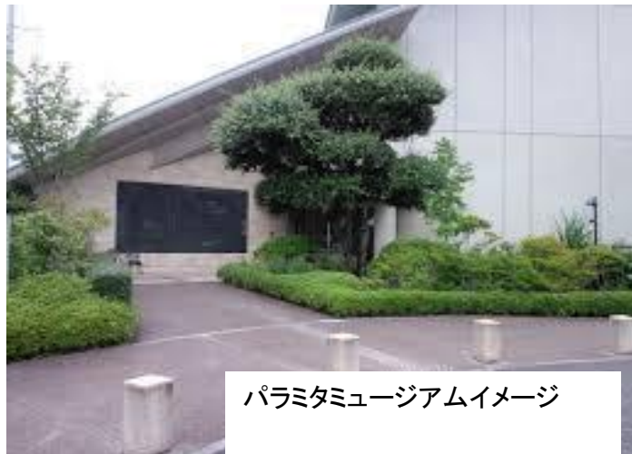
パラミタミュージアムイメージ