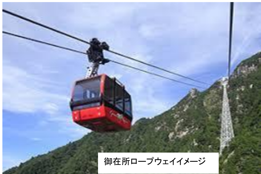
御在所ロープウェイイメージ