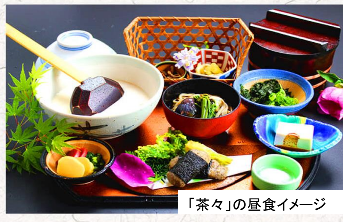
「茶々」の昼食イメージ

ツアーの案内や受付確認書(請求書)最終案内等をメールでお送りできる方は 300円引き になります。詳しくは裏面をお読みください