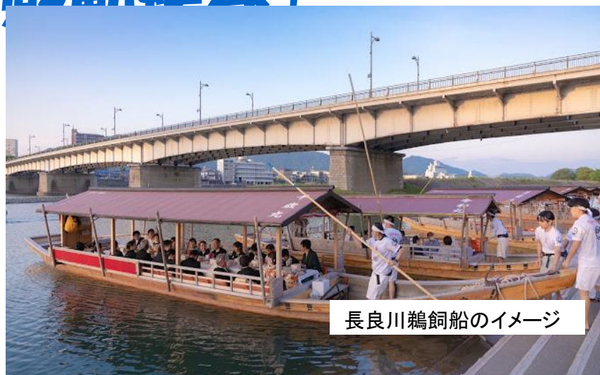
長良川鵜飼船のイメージ

ご出発日 8月23日(金) ご旅行代金 9,800円 メール登録者代金 9,500円