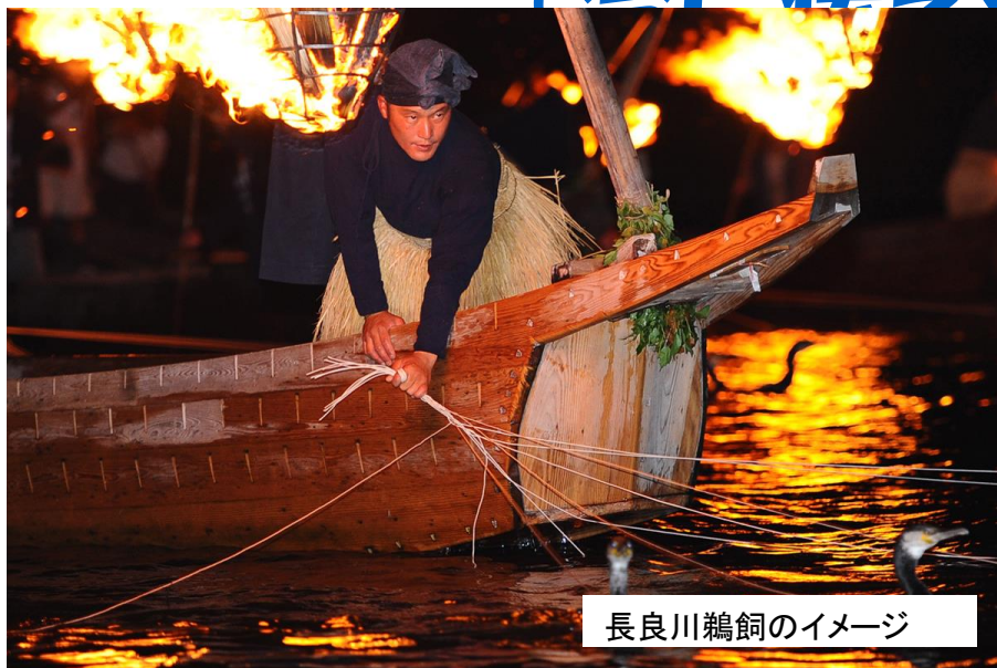
長良川鵜飼のイメージ