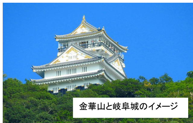
金華山と岐阜城のイメージ

ご出発日 8月23日(金) ご旅行代金 9,800円 メール登録者代金 9,500円