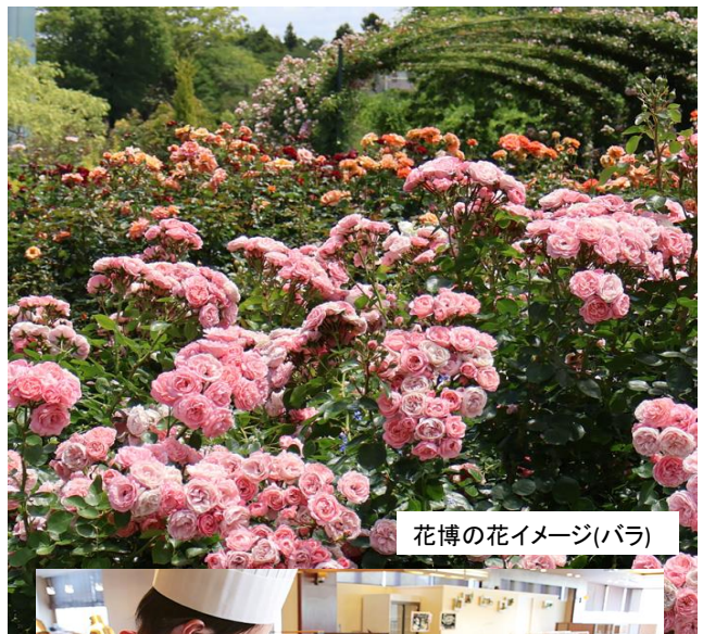
花博の花イメージ(バラ)