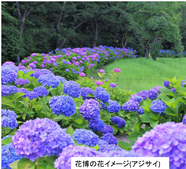
花博の花イメージ(アジサイ)