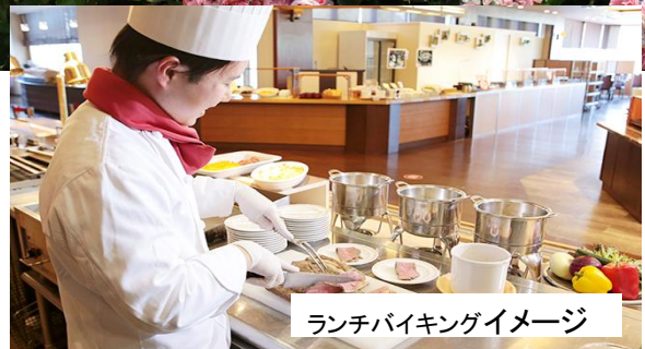
ランチバイキングイメージ