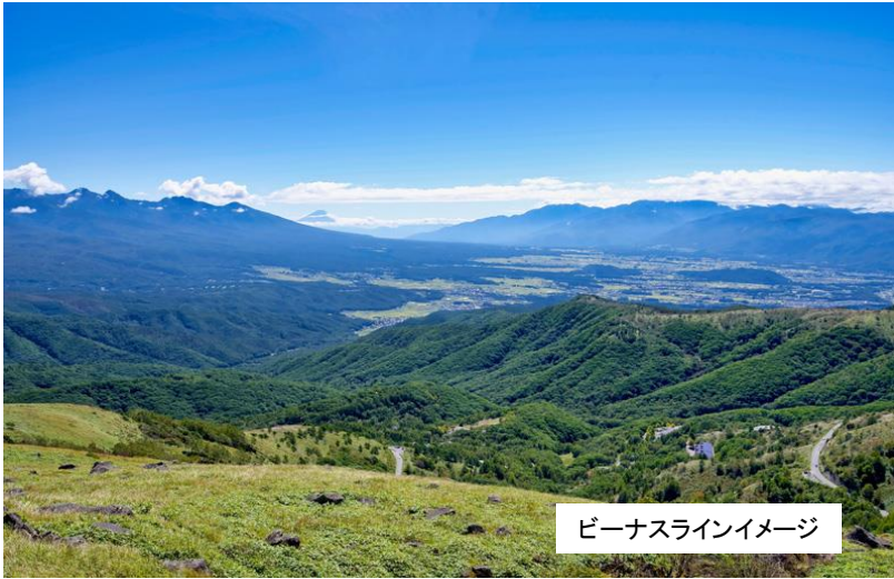
ビーナスラインイメージ