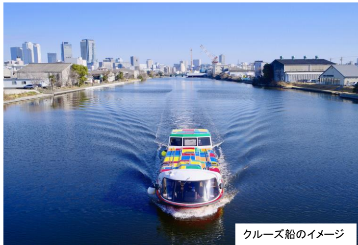
クルーズ船のイメージ