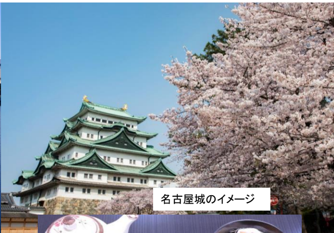
名古屋城のイメージ