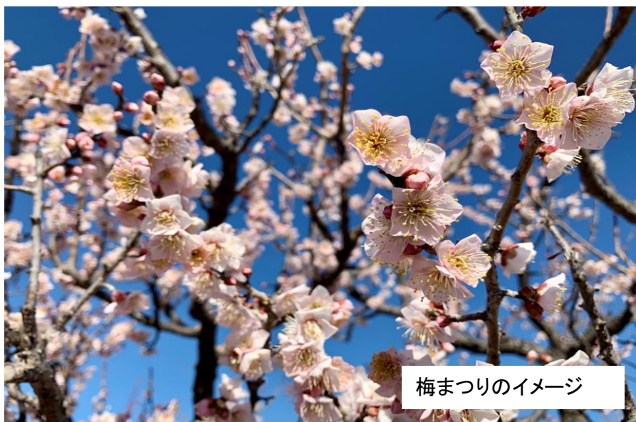
梅まつりのイメージ