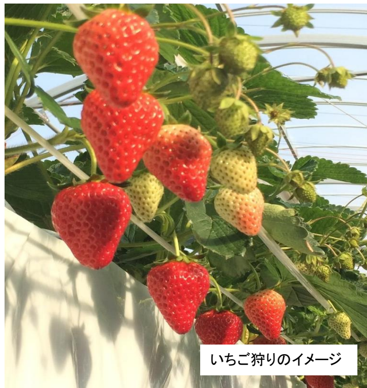
いちご狩りのイメージ