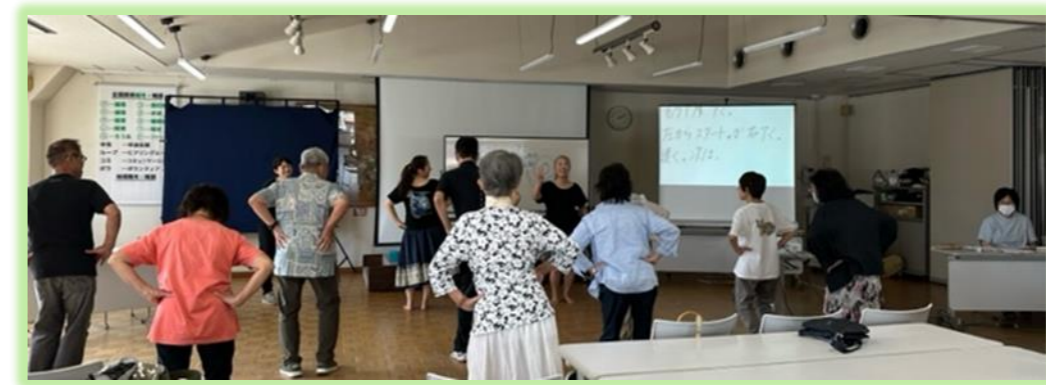
2023年度前期 「ハワイアン健康 フラダンス講座」