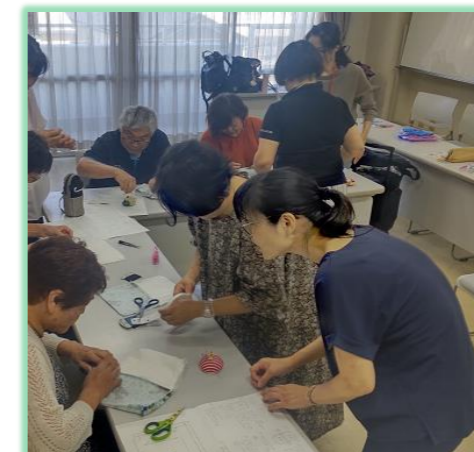
2023年度前期 「手縫いで作るバネポーチ講座」