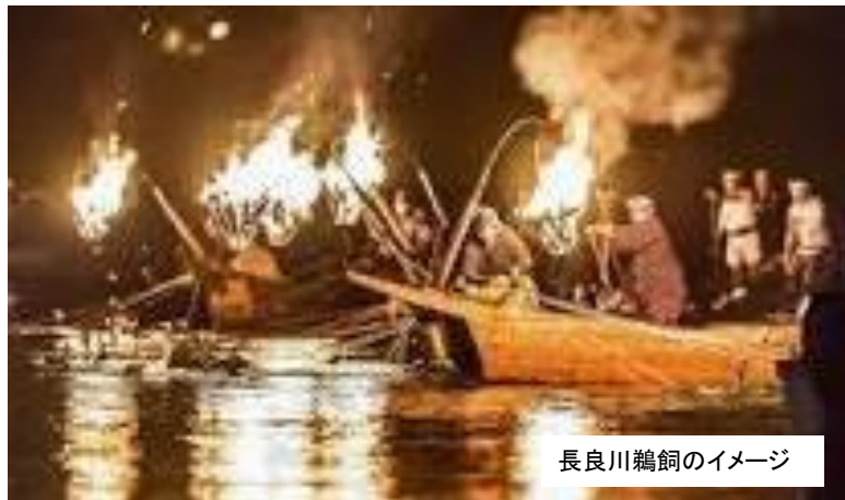
長良川鵜飼のイメージ