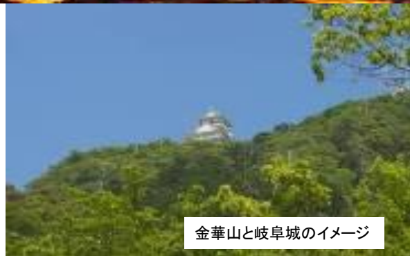
金華山と岐阜城のイメージ