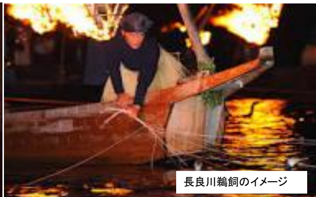
長良川鵜飼のイメージ