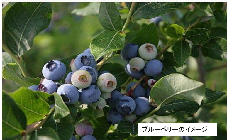
ブルーベリーのイメージ