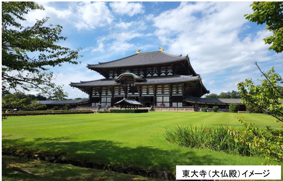
東大寺(大仏殿)イメージ