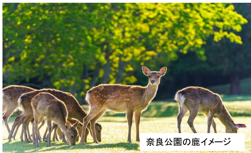
奈良公園の鹿イメージ