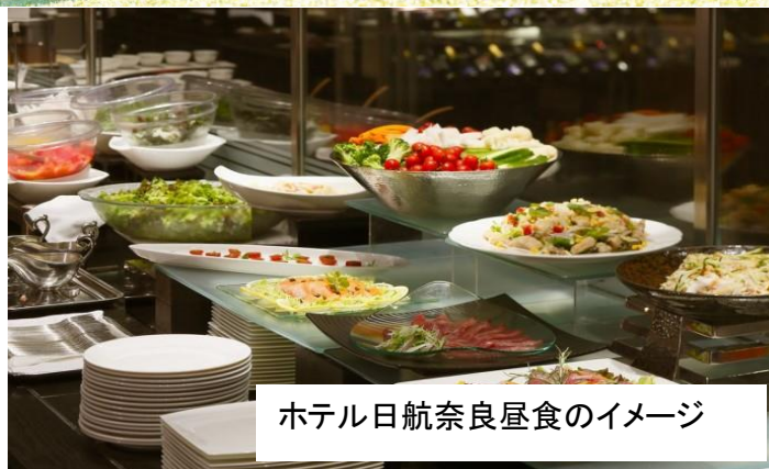
ホテル日航奈良昼食のイメージ