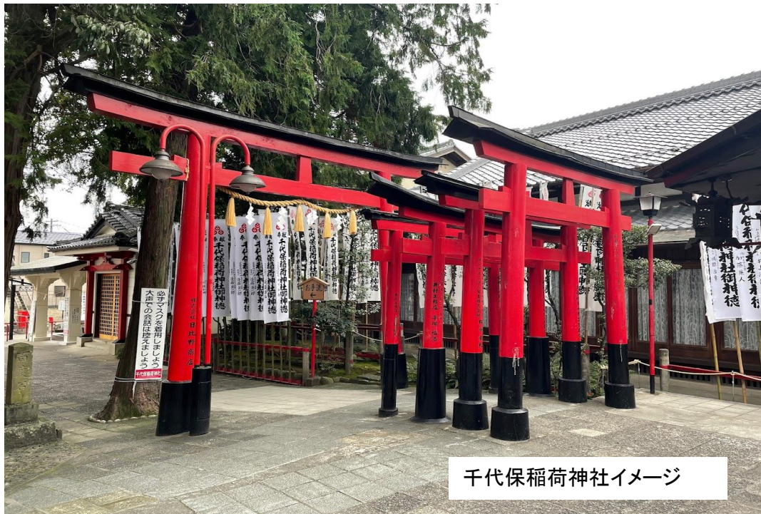
千代保稻荷神社イメージ