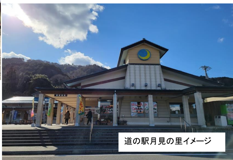
道の駅月見の里イメージ