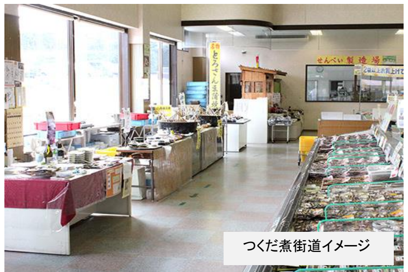
つくだ煮街道イメージ