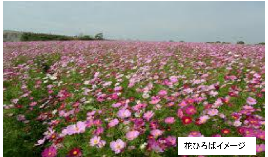
花ひろばイメージ