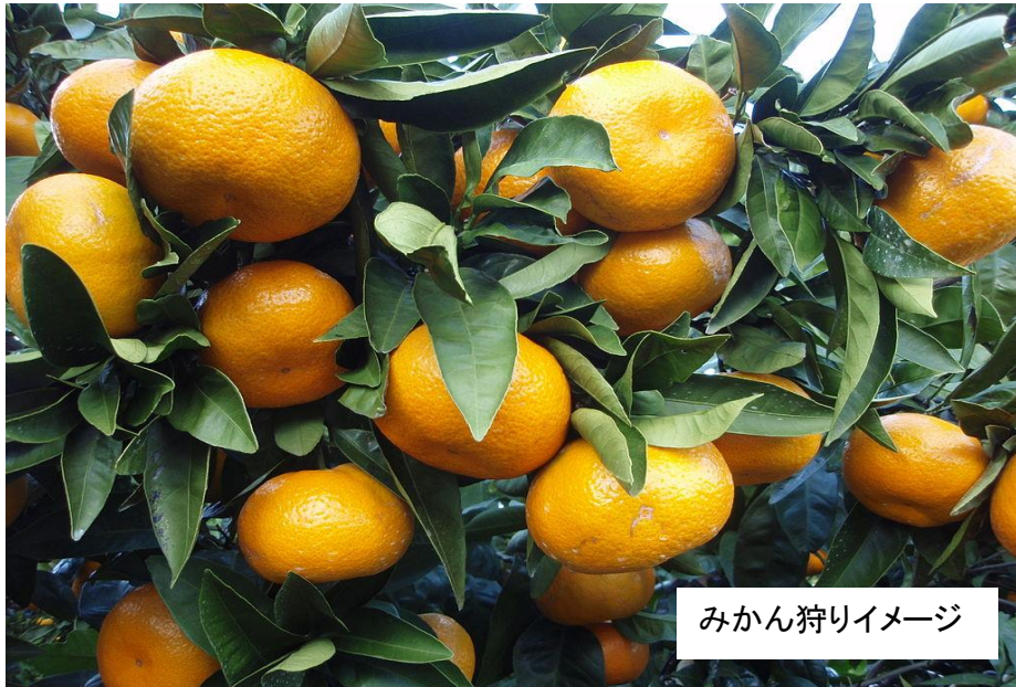
みかん狩りイメージ