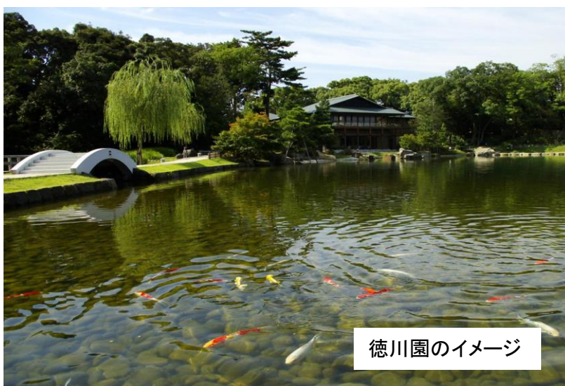
徳川園のイメージ