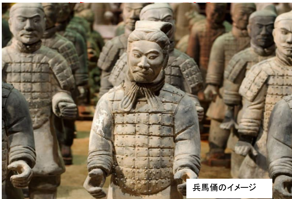
兵馬俑のイメージ