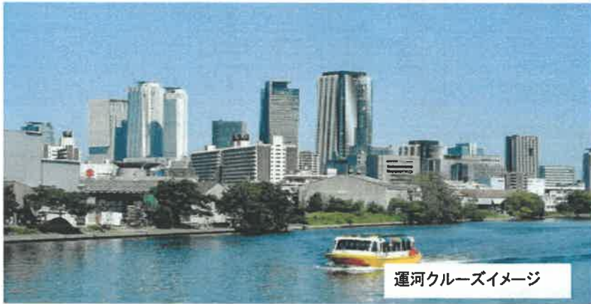
運河クルーズイメージ