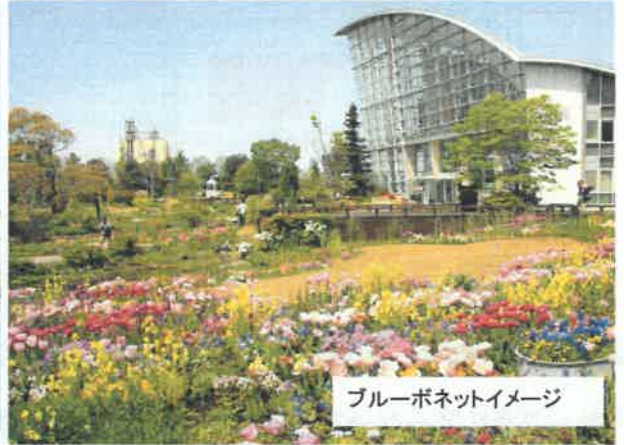
ブルーボネットイメージ