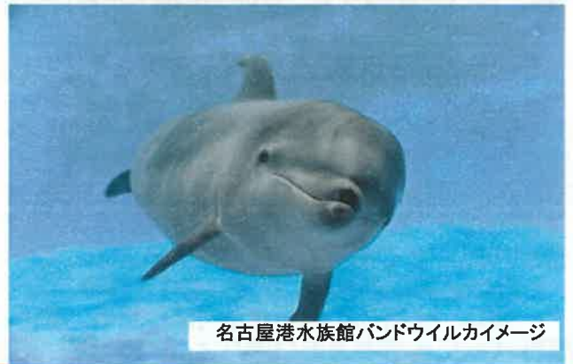
名古屋港水族館バンドウイルカイメージ