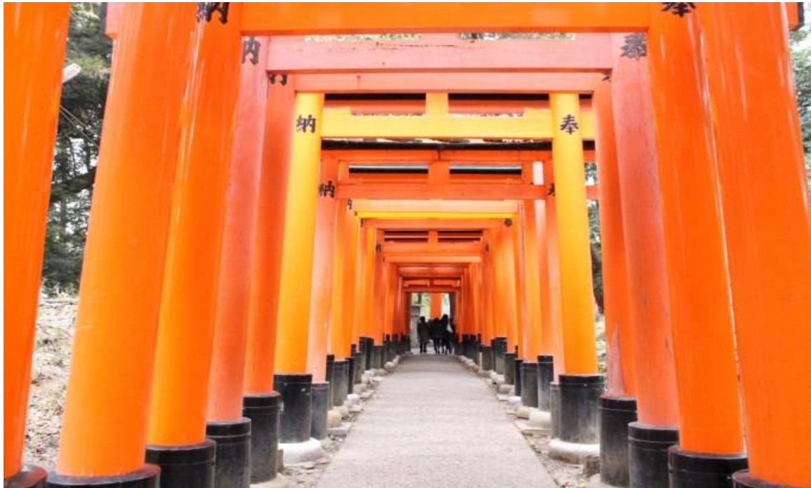
伏見稻荷大社のハイライト千本鳥居