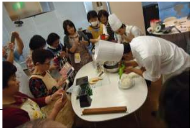
平成27年度後期 「デフパティシエのケーキ教室」