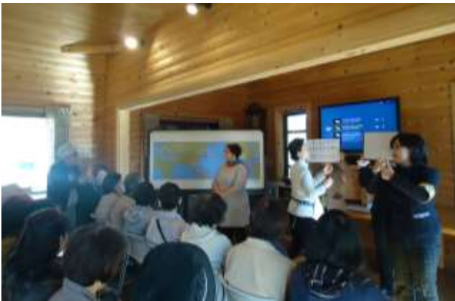
平成27年度後期 「杉原千畝記念館見学ツアー」