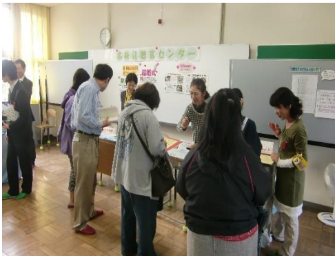
名古屋聾学校の学校祭で参加者にクイズをやっていました！