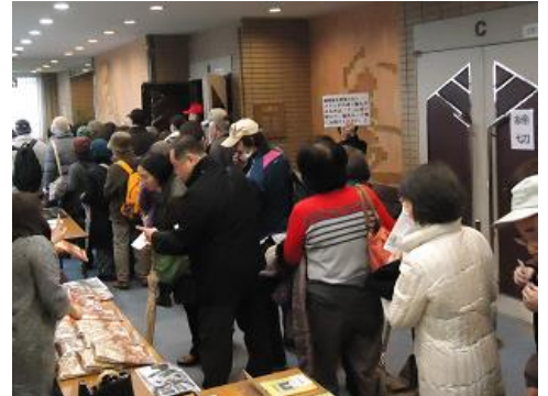
文化フェスティバルで人員整理や受付など手伝っていただきました！

★登録方法・・・別紙の「登録申込書」にご記入いただき聴言センターまでご提出ください