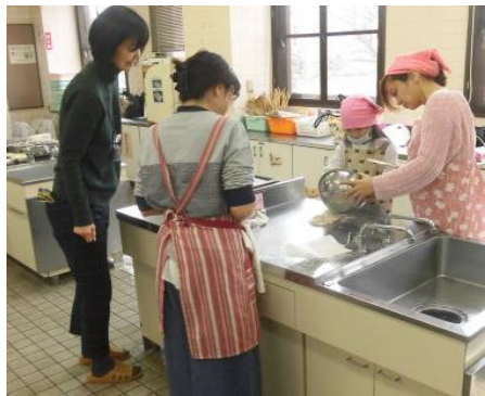
「親子でパン作り」の講座で調理のサポートをしていただきました！