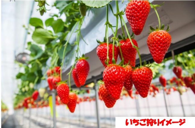
いちご狩りイメージ