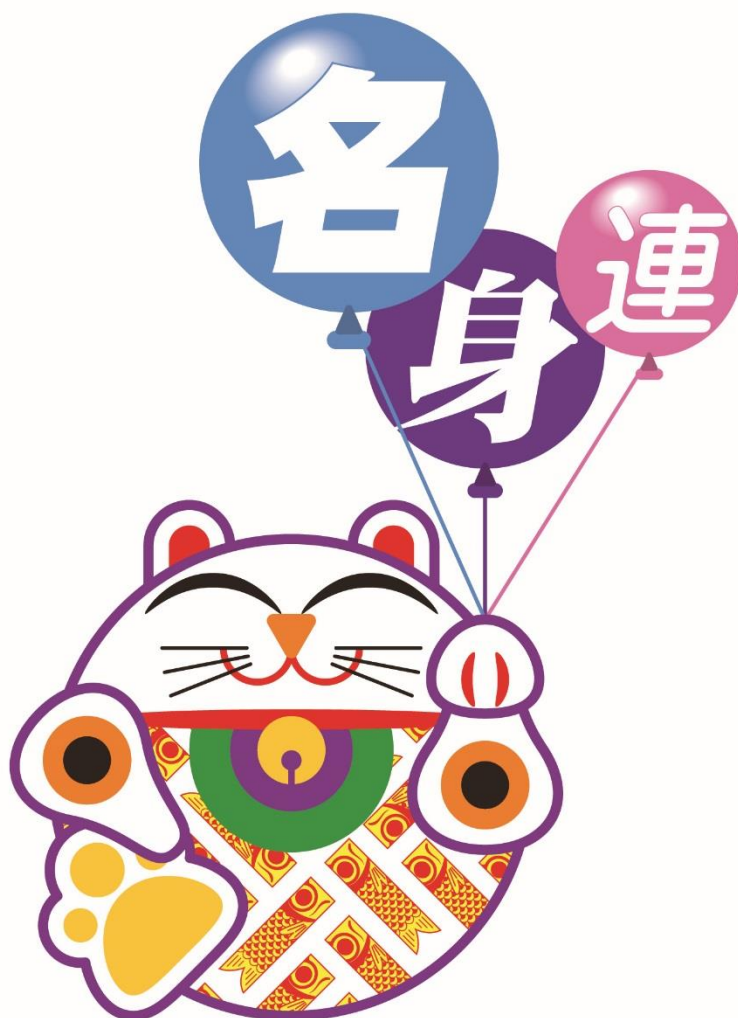
名身連イメージキャラクター「ふくにゃん」

注) 上記個人情報は当法人にて厳重に管理し、当講習以外の目的では使用いたしません。