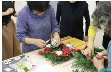
平成28年度後期 「クリスマスリースを作ろう！」