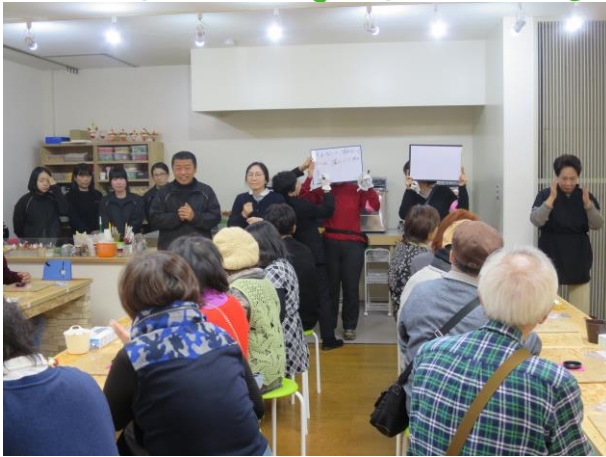
平成28年度後期 「食品サンプル作りとお買物ツアー」