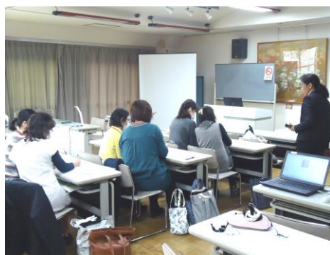
手書きコース実習