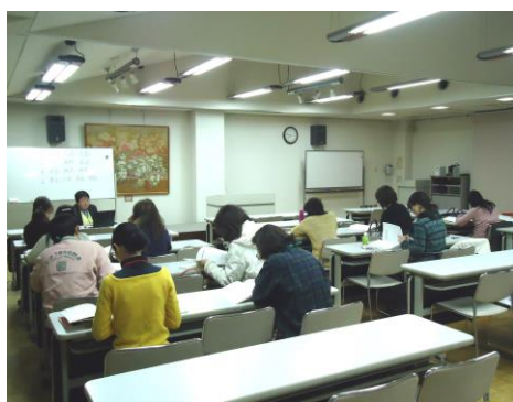
手書き、パソコンコース合同講義