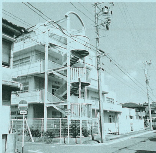
名身連福祉センター外観

③番出口から、左手に出て、中村公園の大鳥居から、豊国神社の参道を北へ。最初の信号を左折し、すぐ次の道を右折してください。