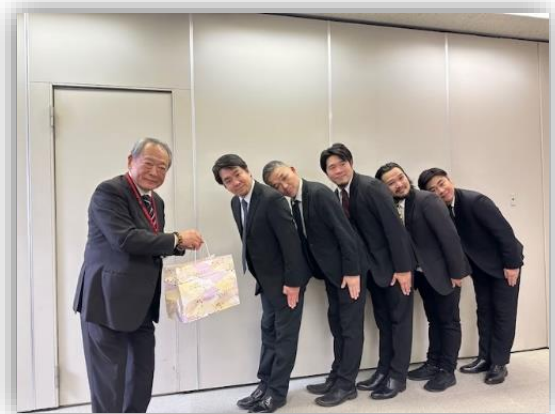
楽屋でのひとコマ