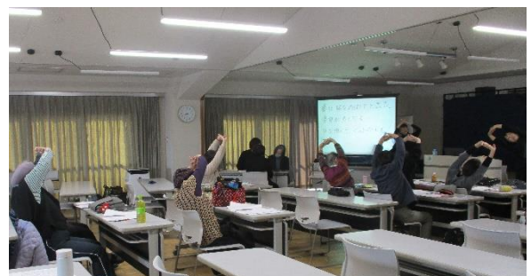
体を動かしながら学びました。