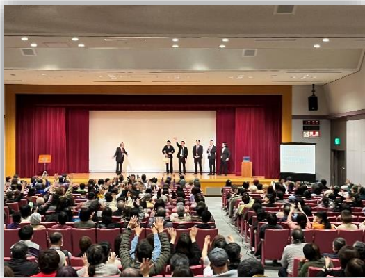
拍手喝采のフィナーレ

来年度も聴覚障害者文化活動フェスティバルを開催予定である。秋頃には詳細をお知らせする予定。是非、楽しみにしてほしい。