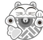
名身連マスコット「ふくにゃん」