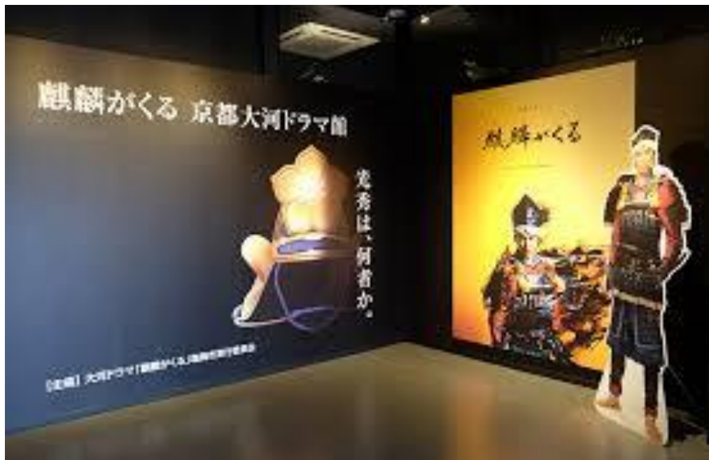
大河ドラマ館イメージ