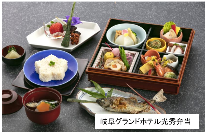
岐阜グランドホテル光秀弁当