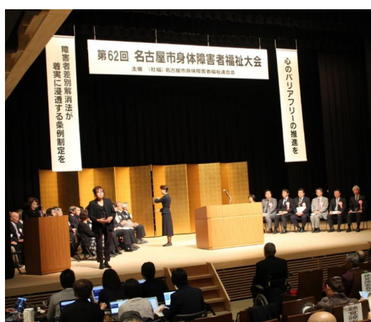
福祉大会 舞台上の様子