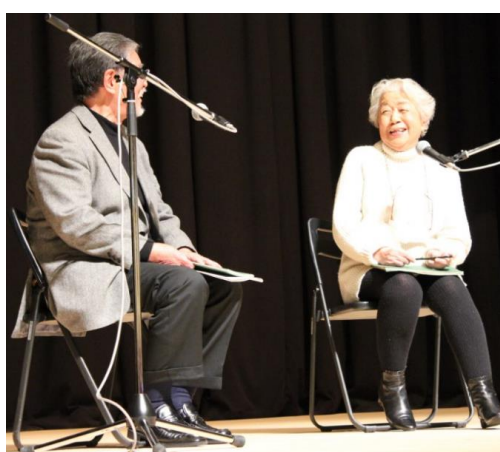
アトラクションの様子