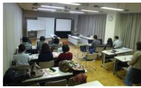
パソコンコース実習

※ 当講習会修了後、名古屋市要約筆記者認定試験に合格された方は、認定要約筆記者として名古屋市に登録し、派遣活動を行うことができます。