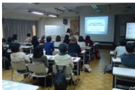
手書き、パソコンコース合同講義