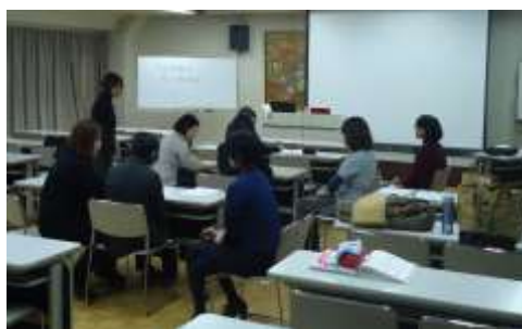
手書きコース実習